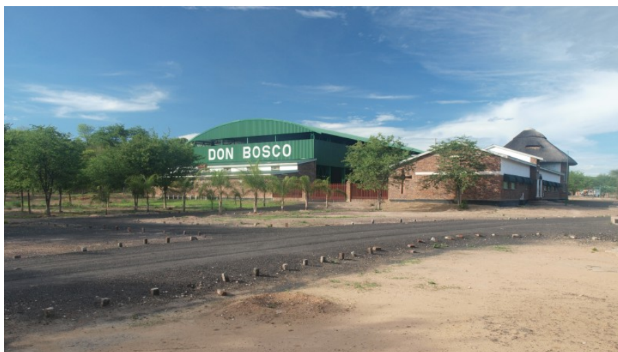
Don Bosco Hwange

V Zimbabwe a v Don Bosco Technical College nastal první školní týden a proto přišel čas doručit do Čech, na Moravu a našim dobrovolnickým kolegům po celém světě první dopis o naší službě v salesiánském centru v buši u města Hwange. Zdejší misie je jednou ze dvou salesiánských komunit v celé zemi a funguje teprve od roku 2006. My sami jsme tady první dobrovolníci po několika letech.