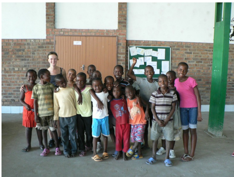
Shromáždění na konci první oratoře

Jedna z věcí, se kterou jsme při příjezdu do Afriky sice počítali, ale jejíž dimenze nás přesto překvapily, je, že všechno tady trvá velice dlouho. A tak trvalo téměř měsíc než se konečně potvrdilo, co bude naší náplní práce. Do té doby jsme pomáhali jenom s drobnostmi. Jedním naším velkým úkolem je vzkřísit k životu oratoř, která zde nefunguje, protože na ni nikdo ze salesiánské komunity nemá čas. Opravili jsme si zničené sportovní vybavení, které zde podléhalo africké údržbě ve stylu "dokud to není na třísky, je to v pořádku". Je pro nás novou zkušeností budovat oratoř úplně od začátku, vytvořit si vlastní pravidla a vychovat děti k tomu, aby si uměly samy společně hrát. První den si každý půjčil svůj míč, některé malé děti si vypůjčily třeba