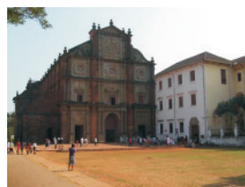
bazilika Bom Jesus