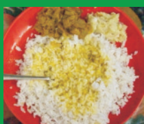
rýže s dálem a zeleninou