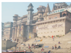
nábřeží Gangy (ghát)