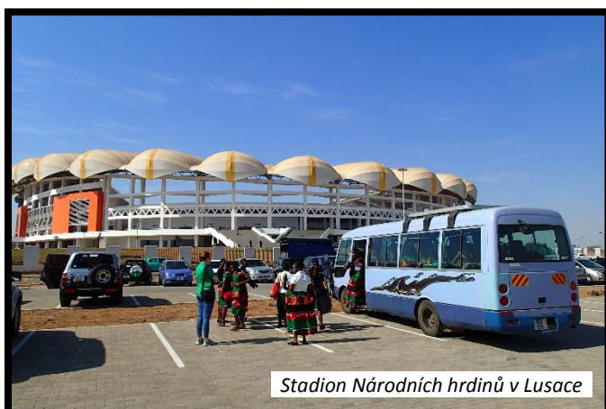
Stadion Národních hrdinů v Lusace

Zabraly jsme nejlepší místa v hledišti a čekaly jsme na slavnostní úvod, který nakonec začal v 12:30.