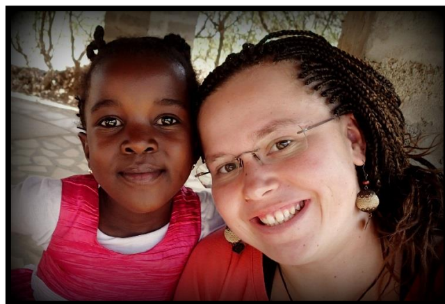
S Hadassah Vám všem posíláme srdečné pozdravy!