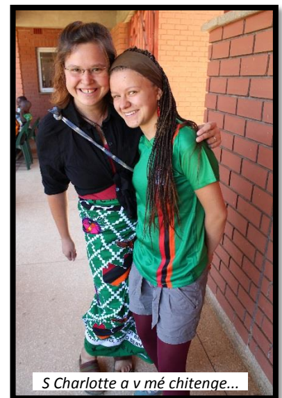
S Charlotte a v mé chitenge ...

Stadion Národních hrdinů stojí na okraji Lusaky. Když jsem ho zahlédla, připadalo mi, jako by sem spadl z Marsu. Mezi chudinskými domky Lusaky, prašnými a kamenitými cestami, dřevěnými konstrukcemi stánků afrických tržišť, se vyjímá obrovský moderní stadion (řekla bych „evropského stylu“) s kapacitou 50 000 lidí.