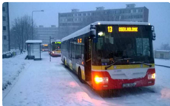
FOTO OD VÁS: Husté ranní sněžení potrápilo řidiče i na Litvínovsku (/zpravy/litvinov/4812-foto-od-vas-huste-ranni-snezeni-potrapilo-ridice-i-na-litvinovsku)